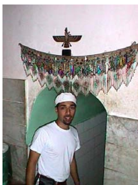
Trita Parsi, at a Zoroastrian temple in Yazd.. By Siamak Namazi

http://www.iranian.com/SiamakNamazi/2000/August/Water/trita.html